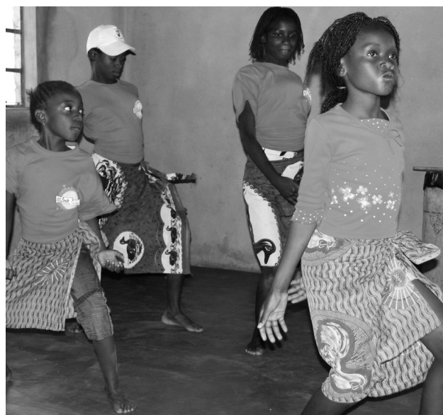
Im Tanzunterricht im Zentrum von LEMUSICA können die Aids-Waisen ihre Sorgen für einen Moment vergessen.

Das Projekt LEMUSICA unterstützt Waisenkinder aus verschiedenen Quartieren von Chimoio, die in besonders prekären Verhältnissen leben. Das Projektteam besucht sie regelmässig zu Hause und versorgt sie mit Grundnahrungsmitteln und Seife. Weiter suchen die Projektmitarbeitenden für die Aids-Waisen nach möglichen Pflegefamilien in der Verwandtschaft oder in der Nachbarschaft der Kinder. Nach der Vermittlung besuchen unsere ProjektpartnerInnen die Kinder weiterhin, um Missbrauch oder körperliche Ausnutzung zu verhindern. LEMUSICA begleitet die betroffenen Kinder und Jugendlichen auch bei der Wiedereingliederung in die Schule. Wird keine Pflegefa-