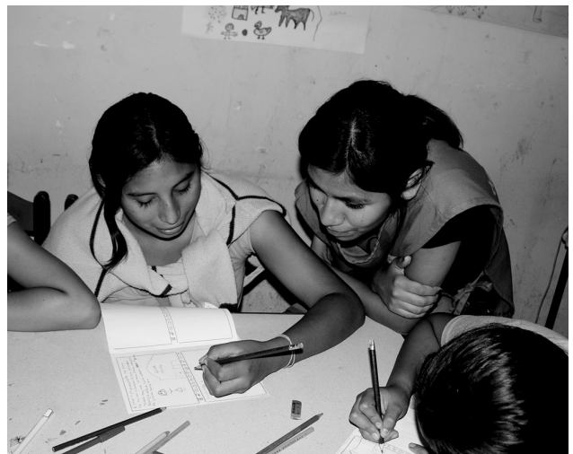
In der „Casa de Panchita“ erhalten die Hausangestellten kostenlose Hausaufgabenhilfe.

Auf der Suche nach einem Ausweg aus der Armut ziehen viele Mädchen und Frauen in die Grossstädte, um als Hausangestellte zu arbeiten. Dort leben sie in der Regel bei der Familie des Arbeitgebers. Sie arbeiten ohne Pause bis zu 15 Stunden am Tag und werden nicht selten um ihren Lohn geprellt. Die Mädchen werden oft beschimpft und geschlagen. Weit weg von ihren Familien und in einem fremden Umfeld sind sie Ausbeutung und Misshandlung schutzlos ausgesetzt.