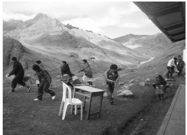
Uchuraccay zählt etwa 500 Einwohnerinnen und Einwohner. Das Dorf liegt im Andenhochland von Peru, rund 4000 Meter über dem Meeresspiegel.

Neben der traditionellen Schule besuchen die Jugendlichen in Uchuraccay die Kurse der Asociación Pacha Uyuwa (APU) . Unsere Partnerorganisation verfolgt in der Arbeit