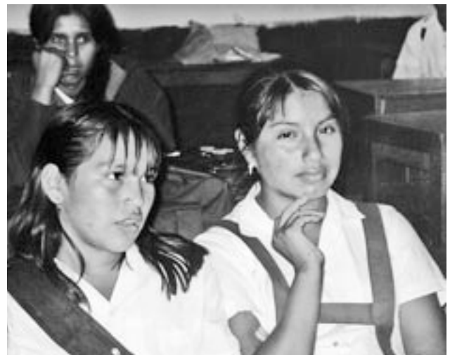
In Workshops informieren sich LehrerInnen über Arbeits- und Kinderrechte und geben ihr Wissen an die SchülerInnen weiter.

Das Projekt unserer PartnerInnenorganisation «Asociación Grupo de Trabajo Redes» hat zum Ziel, die Abwanderung von Mädchen aus Ayacucho in die Hauptstadt Lima zu vermindern. Sie motiviert die Mädchen, die Schule an ihrem Herkunftsort auf dem Land abzuschliessen. Ein weiterer