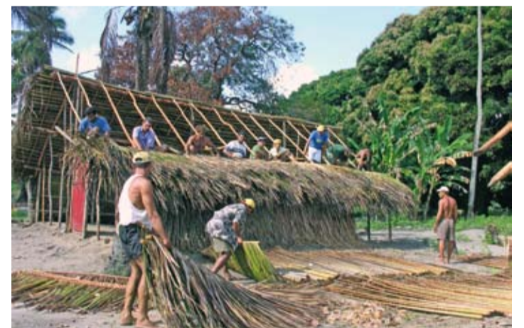
Widerstand: Von der CPT unterstützte Kleinbauern bauen nach einem Brandanschlag ihre Hütten wieder auf.

Bereits in den ersten Amtswochen der neuen Präsidentin gab es Proteste der Landlosenbewegung. Die CPT sandte einen offenen Brief, in dem sie an die Dringlichkeit von Fortschritten in der Landreform erinnerte. Dies wird eine der zentralen Herausforderungen für die neue Regierung sein. Doch ein Wandel der bisherigen Politik scheint wenig wahrscheinlich. Die Erfahrungen der letzten Jahre haben gelehrt: Damit tiefgreifender gesellschaftlicher Wandel möglich ist, bedarf es einer starken und unabhängigen Zivilgesellschaft, welche die Möglichkeiten politischer Einflussnahme nutzt und Kontrolle auf die Regierungsprogramme ausübt. terre des hommes wird weiter an der Strategie festhalten Basisorganisationen in Brasilien zu unterstützen, die Veränderungen von unten möglich machen.