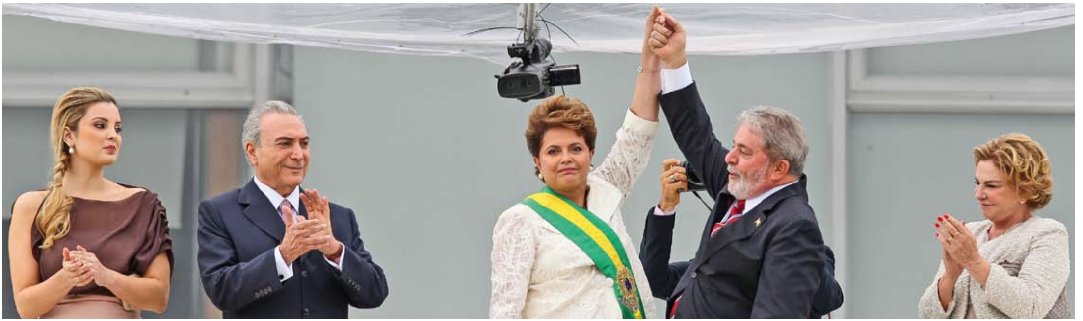
Erfolgreiches Gespann: Lula da Silva übergab seiner Wunschnachfolgerin Dilma Rousseff das Präsidentenamt. Sie steht für die Weiterführung seiner Politik.