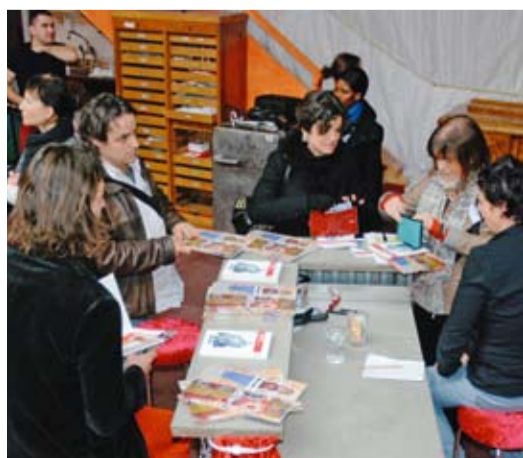
Beliebter Treffpunkt: Die Büchertheke mit Informationsunterlagen.